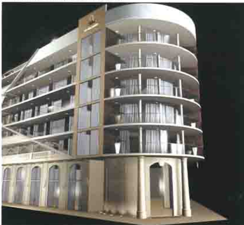
Hotel les Ambassadeurs - Casablanca (Marocco)