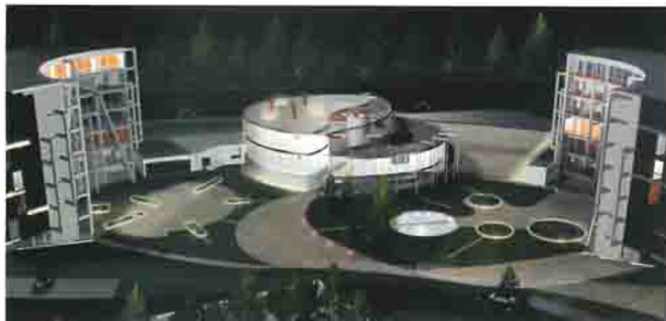
Campus Universitario "Il Pestino" - Verona

Uno spazio estroverso inserito nella natura in cui le essenze del Mediterraneo definiscono sia il design sia l'idea di centro benessere.