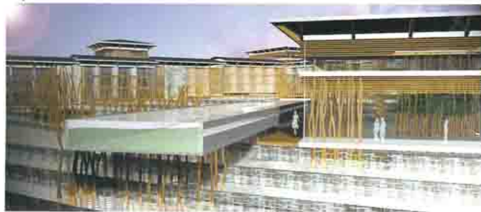
Guangxi spa resort - Cina

Un centro pensato per essere in diretto contatto visivo e fisico con il parco di LECCI di proprietà tramite enormi vetrate in prossimità delle quali sozzare o riposare.