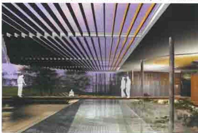
Centro Benessere "Salus per Arbores" - Toscana

Ecco come la sensibilità orientale rispettosa dell'acqua e del suo valore naturale e simbolico costituisce il fattore determinante per la progettazione e l'ingrediente base per la soddisfazione emotiva e psicologica della clientela.