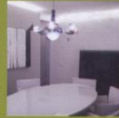
Arte e design ATTICO A VICENZA