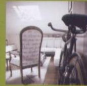
Rifugio di passioni UNIFAMILIARE A SCHIO