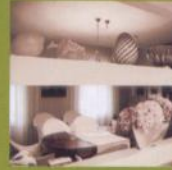
Ambienti Decò FRA LE MURA IN CITTÀ