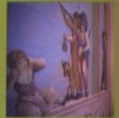
Charme sui colli VILLA AD ARCUGNANO