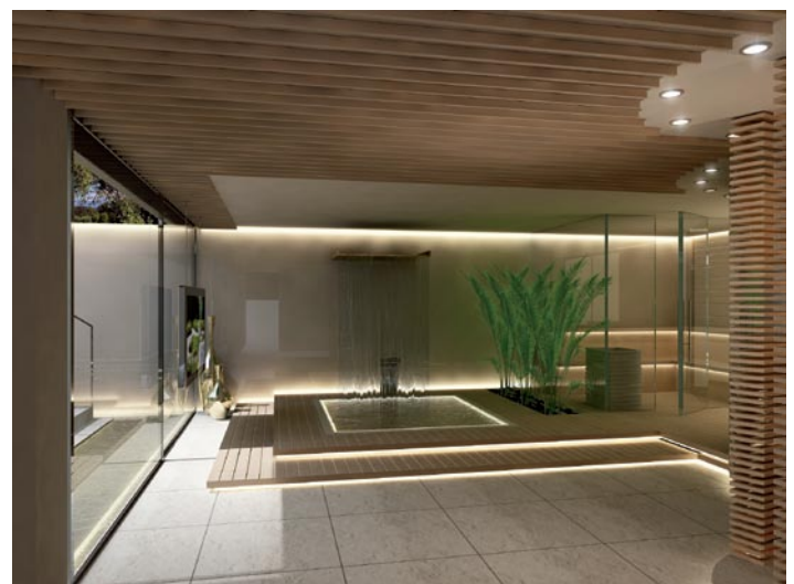
Progetto per una Home SPA, rendering Studio Apostoli

Non più quindi spazi o aree intese come estensioni o rivisitazioni dell'area bagno, bensì autentiche "isole" dedicate, spesso "esibite" come status sociale e culturale.