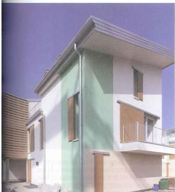
Cantiere Residenziale Santa Caterina a Verona