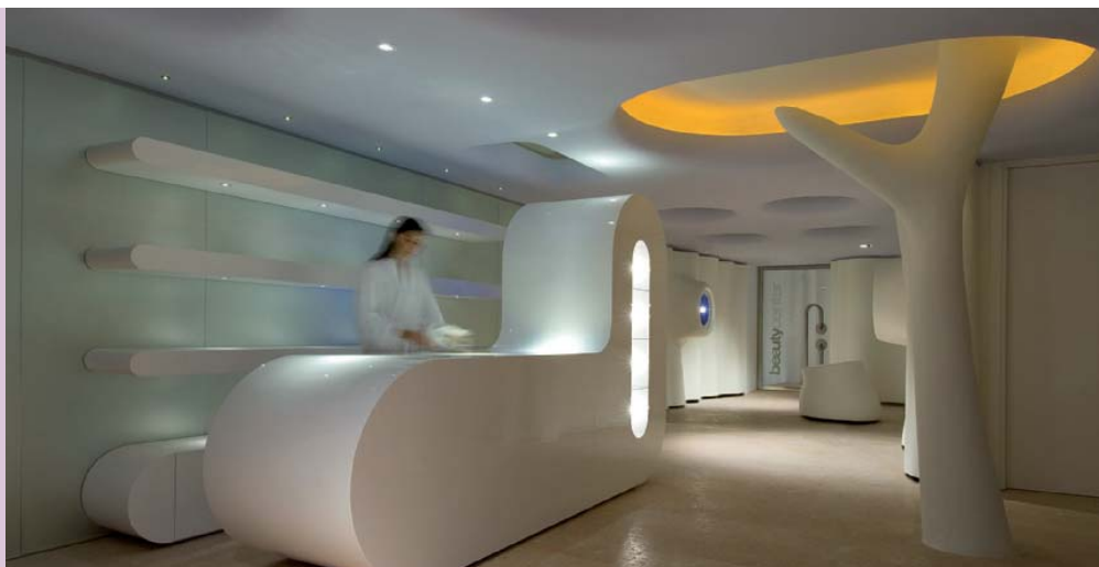
Exedra Hotel Milano ospita una spa creata da Simone Micheli al fine di trasportare il visitatore in una dimensione surreale e metafisica

In questo percorso, le scelte legate all'architettura degli interni rappresentano il momento più delicato. Colori e illuminazione svolgono un ruolo determinante nell'elevare il livello di benessere percepito dai clienti, come peraltro insegnano i numerosi studi clinici al riguardo. La qualità dei materiali, dei