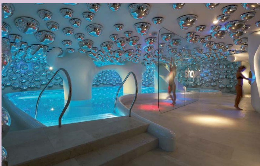
Secondo Simone Micheli, se l'obiettivo consiste nel risveglio della dimensione polisensoriale si possono compiere innumerevoli tragitti e infinite combinazioni degli elementi