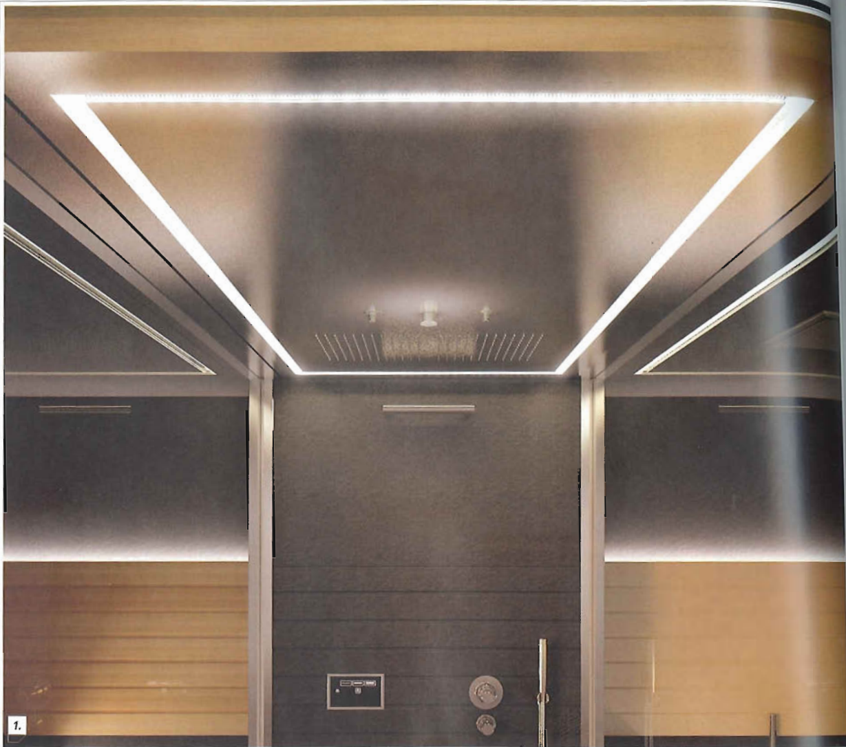
1. UN DETTAGLIO DEL DOCCIONE.