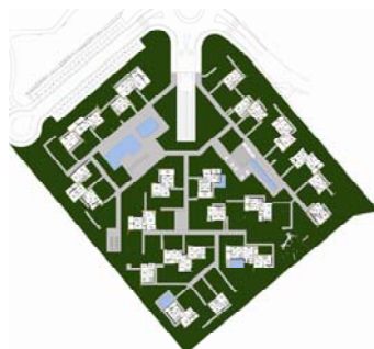
Immagine 04 (Coperture)