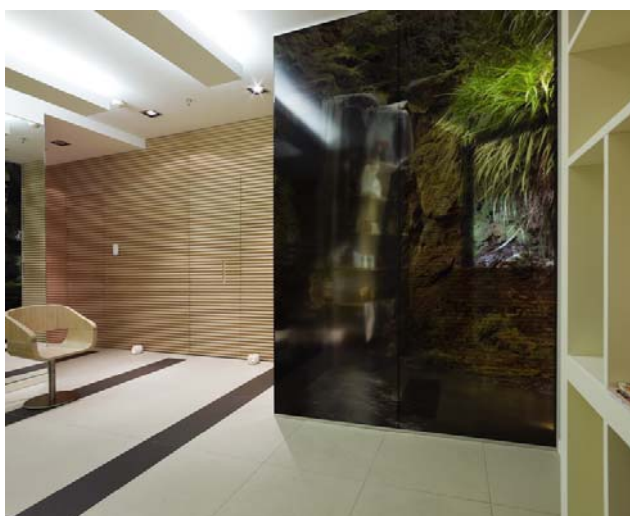
Attesa1 13962