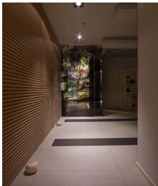
Corridoio 13990