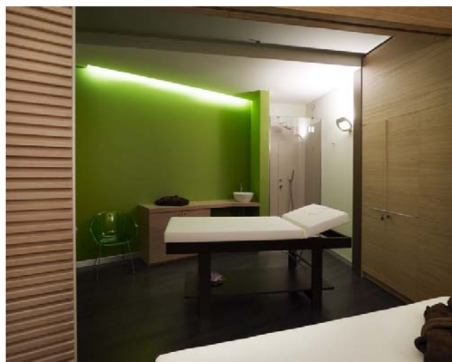
Cabina2 14043