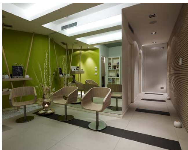
Attesa2 13972