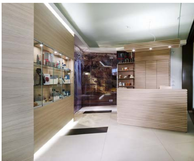
Ingresso2 13926b