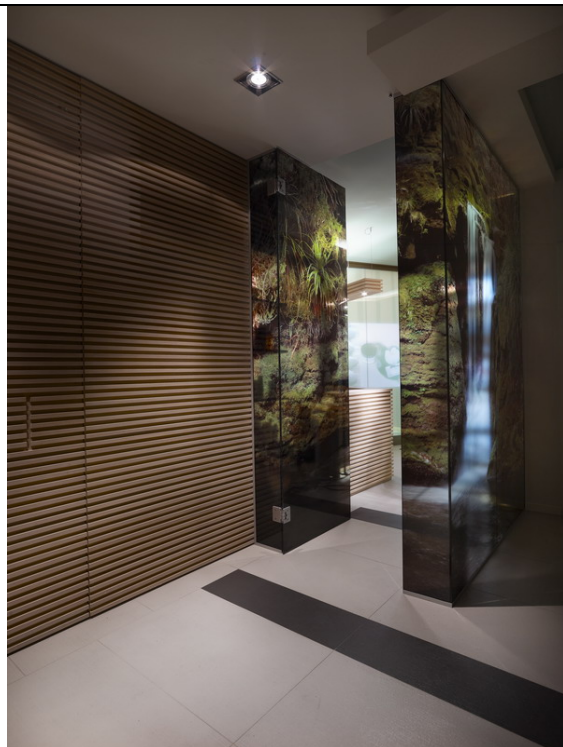
Ingresso1 13923