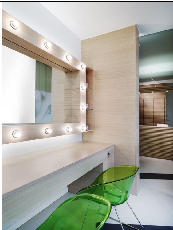
Zona trucco 13912

Art Peté: centro benessere "conviviale" Alberto Apostoli e Fisiosphere, insieme per una nuova formula di benessere