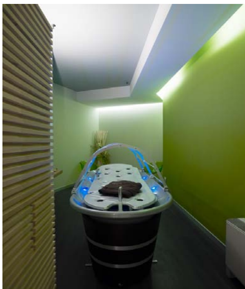
Nausicaa 14005