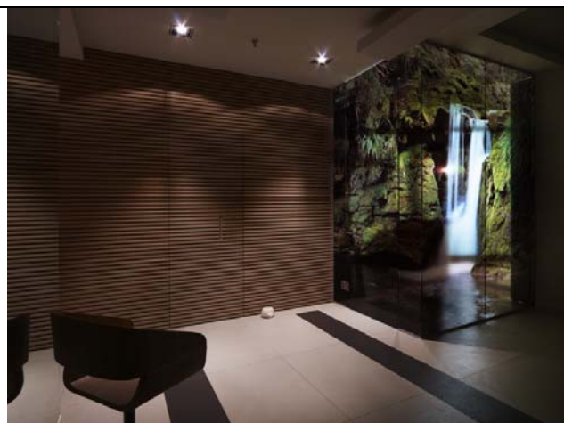
Attesa3 14001