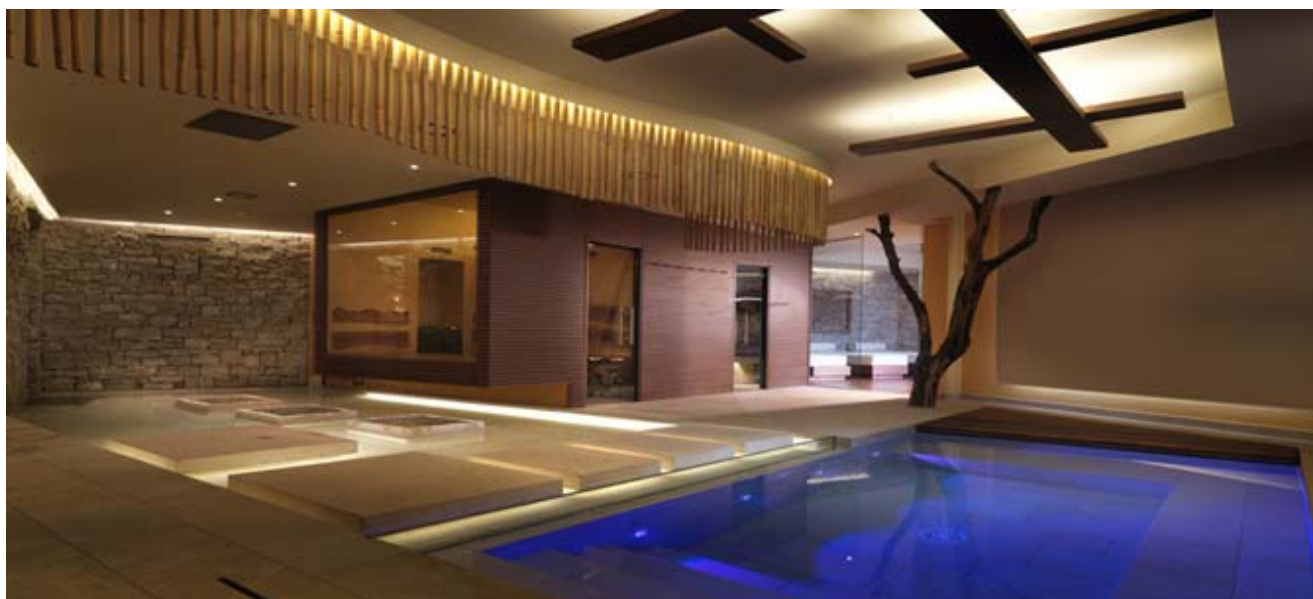
Il wellness hotel floor di Alberto Apostoli (parte seconda) Terminati i lavori de "L'Eliseo" fashion store, firmato da Alberto Apostoli Alberto Apostoli per Fabbian: nasce WLC - wellness light collection