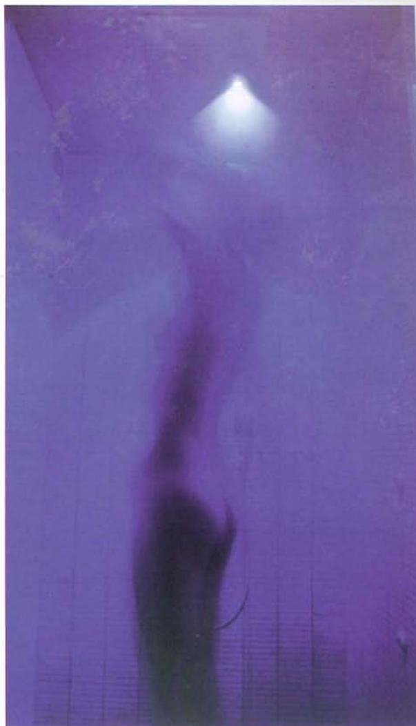
↑ Salus Per Arbores | by Studio Apostoli