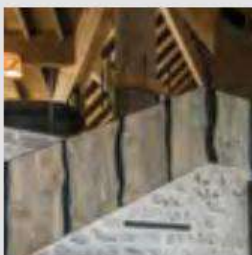
The extensive use of stone and natural wood cladding is a tribute to local architecture.