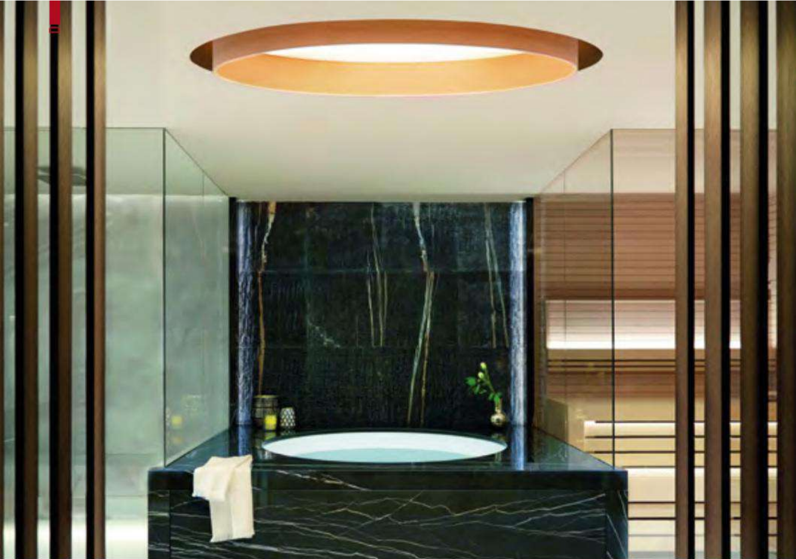
The suites and apartments provide similar solutions.