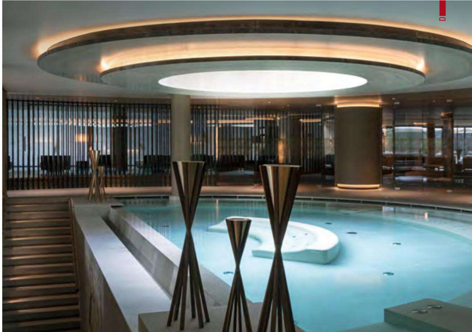
The Spa features high-quality finishes: natural oak parquet, light-colored leather upholstery, and stone walls.