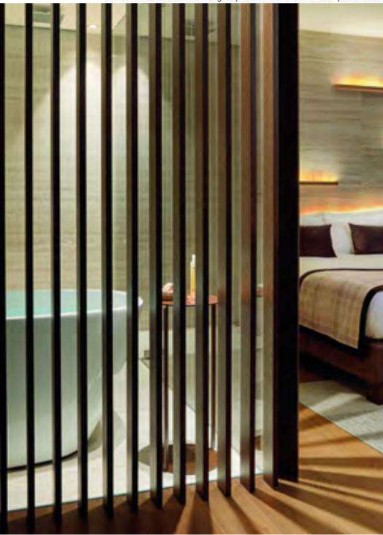
LEFT: two areas of the large Spa. ABOVE: the outdoor pool. BELOW: a room with 'permeable' bathroom.