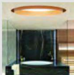
Bedroom and bathroom coexist in the same space according to the most contemporary trend.